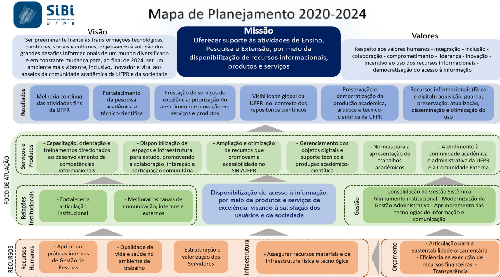
FIGURA 3 - MAPA DE PLANEJAMENTO DO SiBi/UFPR