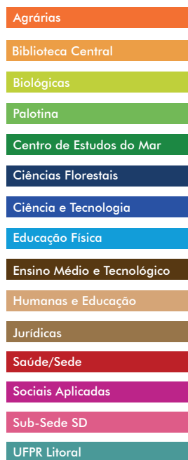
Gráfico 13.1 - Acervo Total, por Setor - 2006